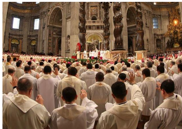
Basilica Tempio Malatestiano Cattedrale di Rimini Via IV Novembre,36 "Rn"

Partenza ore 14,30 da Viserba Mare davanti Oratorio con auto muniti e pulmino